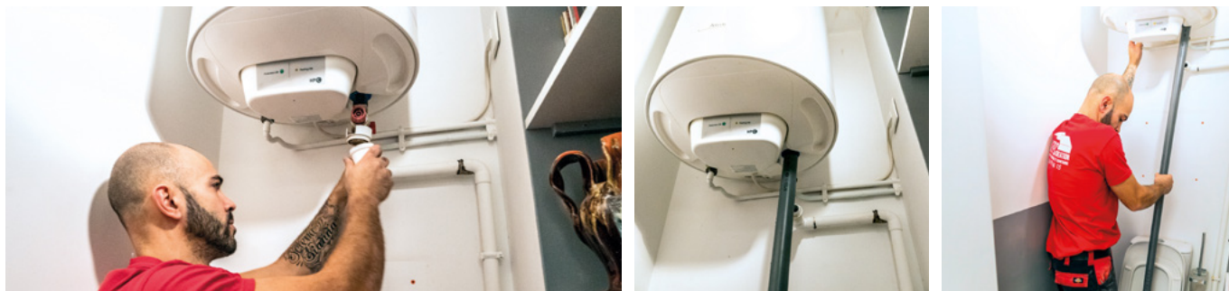
Démontage de l'ancien chauffe-eau et vidange directe dans la cuvette des toilettes.