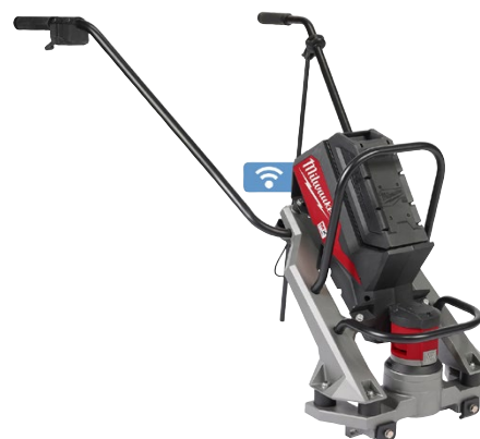
Règle vibrante MXF PSC