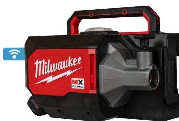
Aiguille vibrante MXF CVBC