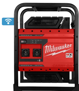
Générateur MXF PS-602X

Le générateur MXF PS-602X, l'aiguille vibrante MXF CVBC et la règle vibrante MXF PSC MILWAUKEE® sont équipés de la technologie sans-fil ONE-KEY™ qui permet de contrôler, suivre, gérer, programmer et verrouiller à distance (en cas de perte ou de vol) les machines depuis un smartphone ou votre ordinateur.